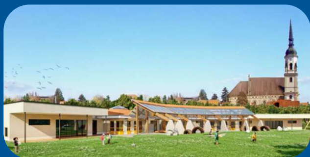
Gemeindegebäude müssen mit Strom und Wärme versorgt werden